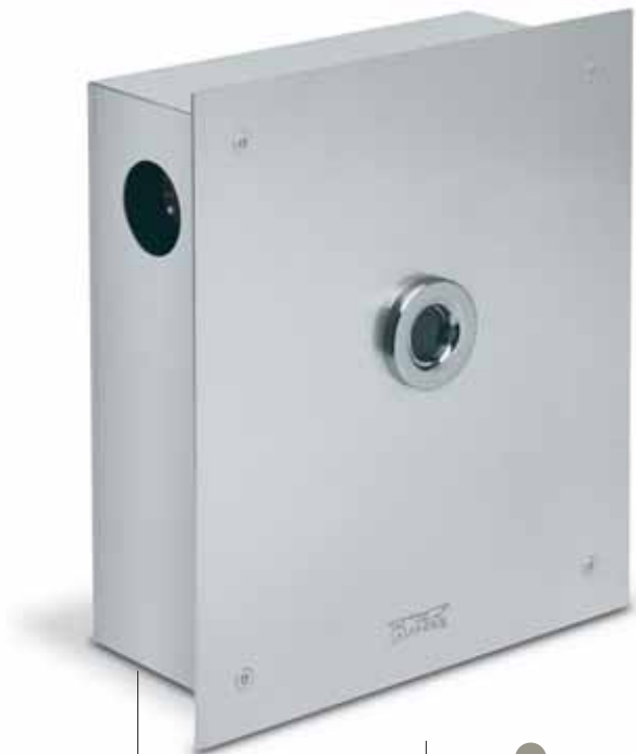
■ box n. 2

infrared vandal-proof flushometer Ø 3/4" for w.c.