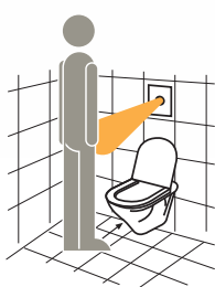
■ box n. 1